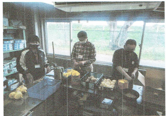
玉ねぎの梱包作業の様子